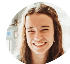
Laure Subventions privées