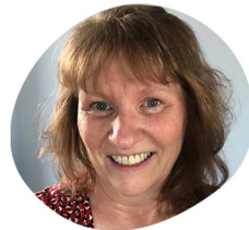
Agnès Subventions privées