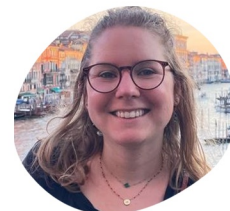
Laura Subventions publiques