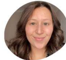
Luna Réseaux sociaux