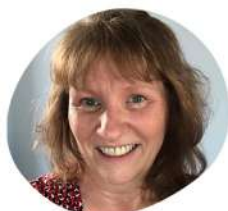
Agnès Subventions privées