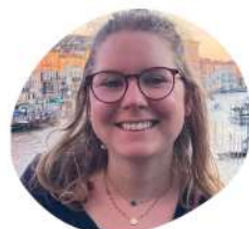
Laura Subventions publiques