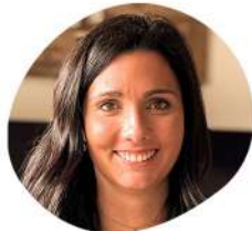
Floriane Sujets transverses