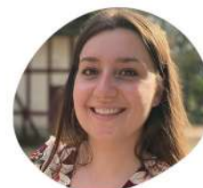
Lucie Sujets transverses