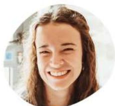
Laure Subventions privées