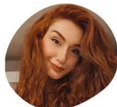
Donara Responsable Communication