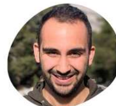
Yoan Communication générale