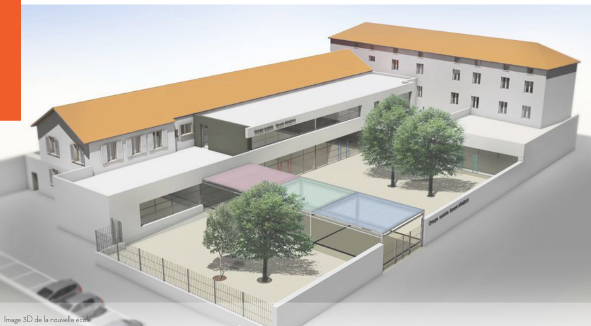
Image 3D de la nouvelle école

Nous espérons que la construction de ce type d'établissement va permettre aux futures générations françaises d'origine arménienne de se sentir « 100 % arménien et 100 % français » comme avait le disait Charles AZNAVOUR.