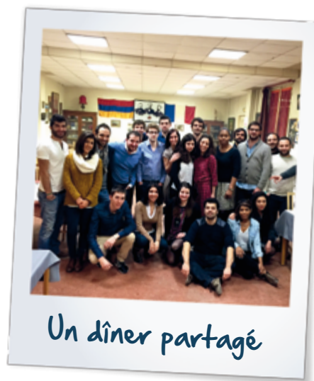
Un dîner partagé

Comme chaque année, AYO apporte son soutien à un jeune élève qui souhaite effectuer sa scolarité dans un établissement bilingue franco-arménien en France, et qui rencontre des difficultés financières pour ce faire. A ce titre, AYO a financé les frais de scolarisation d'un élève de l'école « Hamaskaïne-Tarkmantchadz » d'Issy-les-Moulineaux pour cette année scolaire 2015/2016. Nous lui souhaitons plein de réussite !