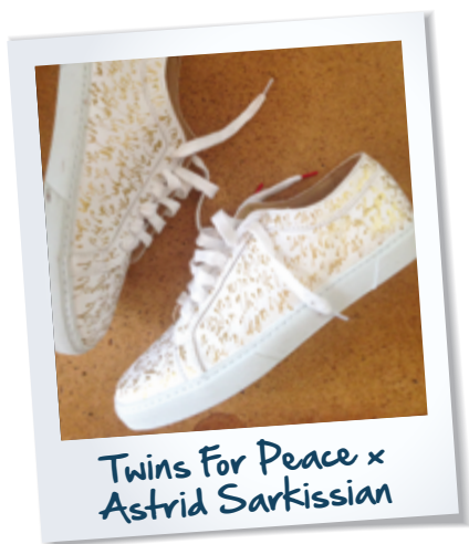
Twins For Peace x Astrid Sarkissian

Le travail de création bat son plein en ce moment, les prototypes sont en production. Il donnera naissance à la Collection Twins For Peace x Astrid Sarkissian pour AYO en 2016. Amis d'AYO, soyez rassurés, nous vous y réserverons un accès en avant-première !