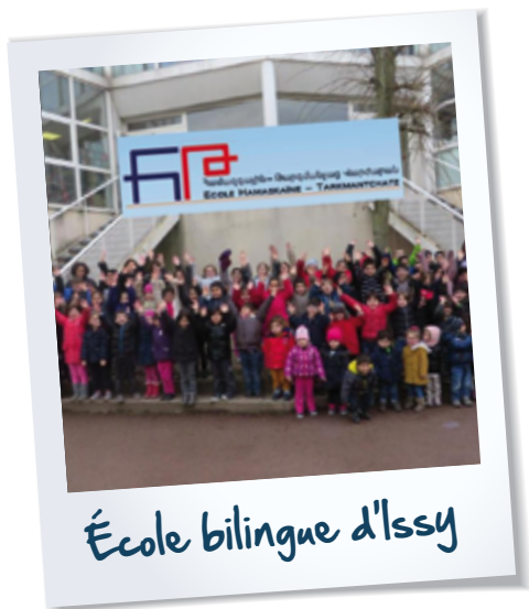
École bilingue d'Issy