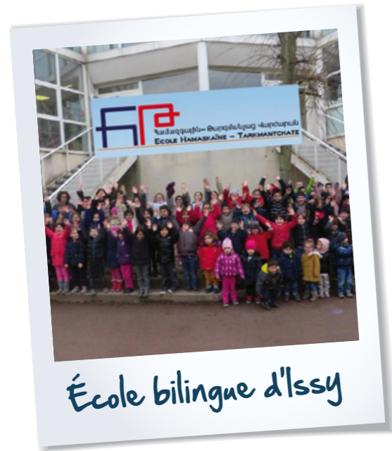
École bilingue d'Issy