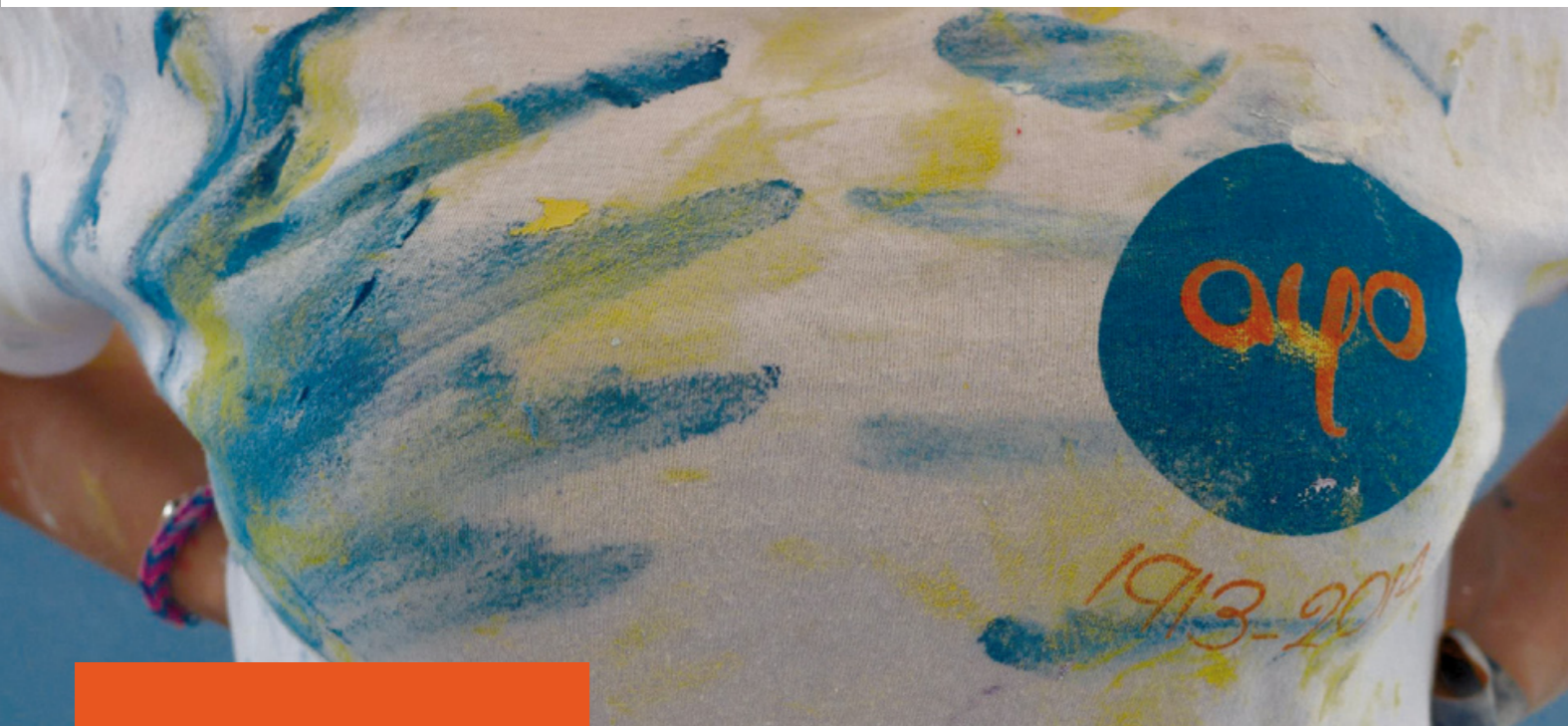
Tenue «officielle» des bénévoles AYO en pleine activité !