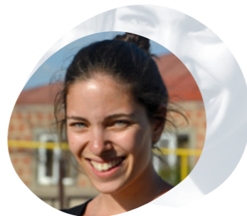
Palig TRÉSORIÈRE DAYO

“ Venir en aide aux personnes dans le besoin m'a fait prendre conscience des valeurs essentielles de la vie. Notre présence et l'aide que l'on apporte aux écoles en Arménie rendent les enfants heureux. En échange, nous recevons énormément de joie grâce à leurs sourires. J'ai participé plusieurs années de suite aux missions d'AYO en tant que bénévole, ce qui m'a apporté des souvenirs uniques. J'ai alors encouragé d'autres jeunes à vivre cette même expérience et je continuerai de le faire encore longtemps. En tant que trésorière, je suis ravie de pouvoir mettre bénévolement mes compétences professionnelles au service d'une telle cause. ”