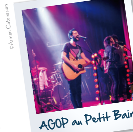
AGOP au Petit Bain