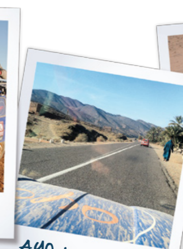
AYO dans le désert !