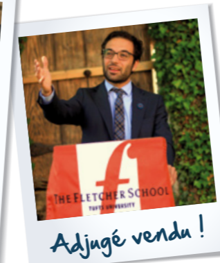
Adjudé vendu !