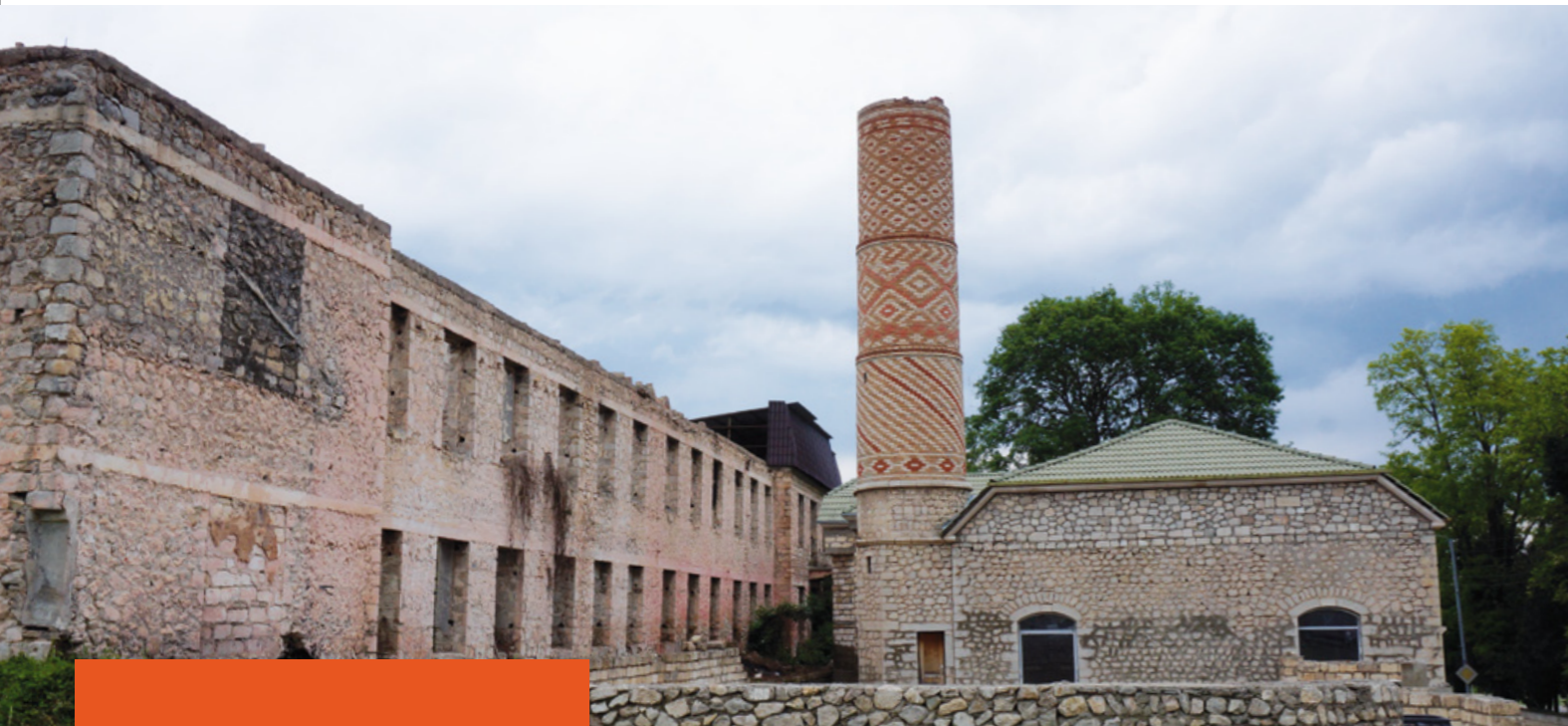
Vue extérieure de la Madrasa de Chouchi et son jardin