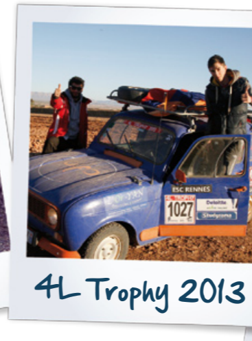
4L Trophy 2013