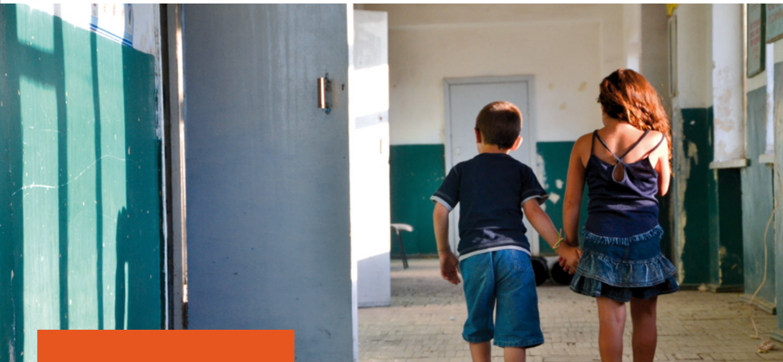
La fraternité dans les couloirs de la maternelle de Bjni