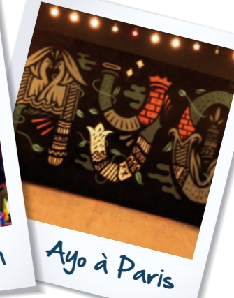
Ayo à Paris