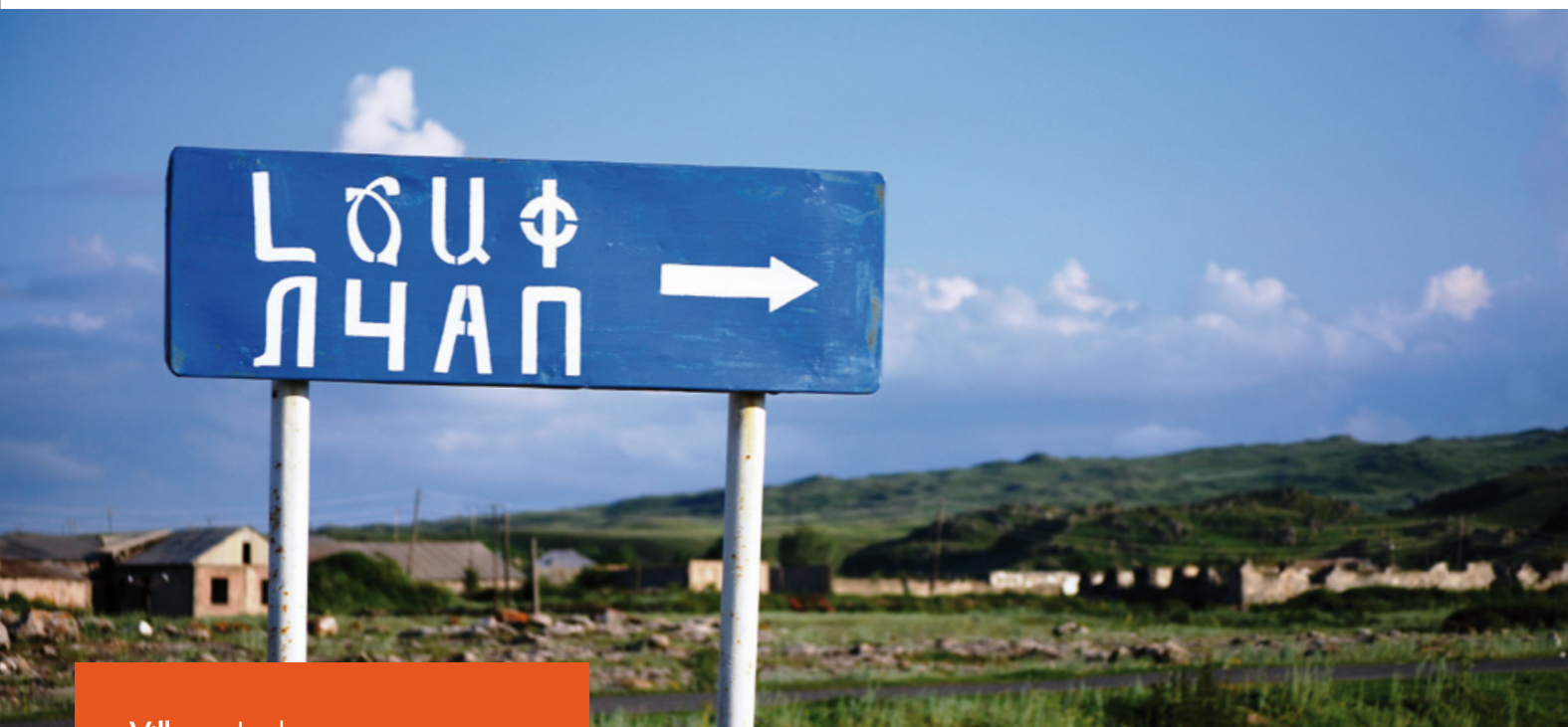
Panneau affichant l'entrée du village de Ledjap