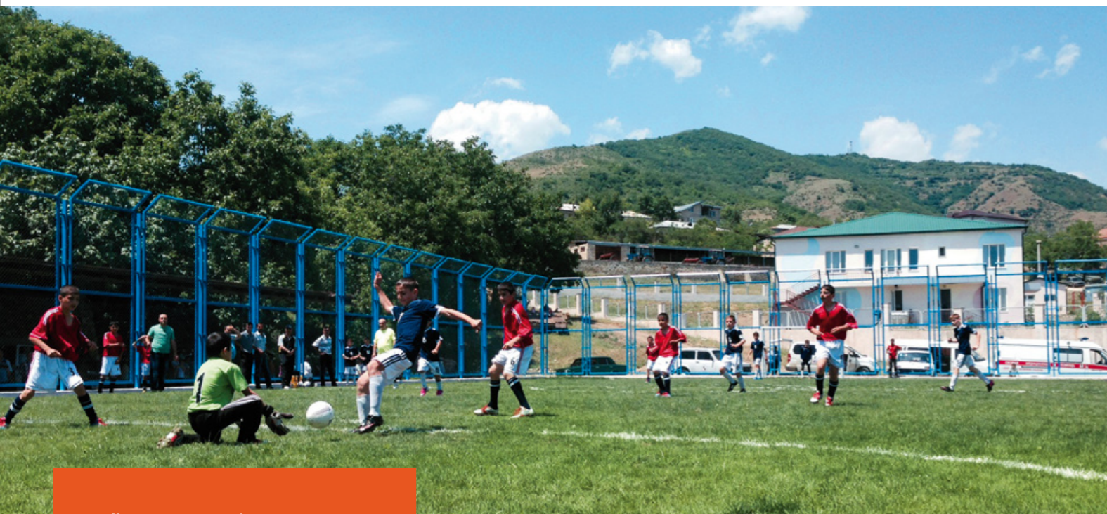
Match d'inauguration du Stade en mai 2014 entre deux équipes de football locales